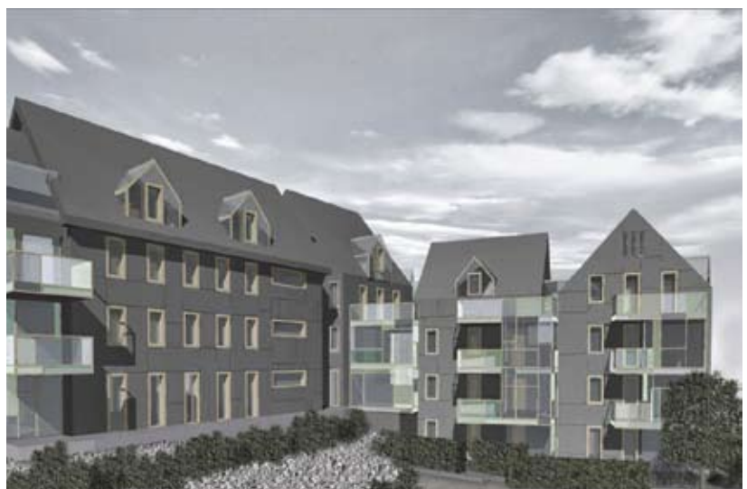
Das Projekt Rütibohl in Langnau vermochte den Wohnsinn-Vorstand nicht zu überzeugen. Es bot zu wenig Gemeinschaftliches.

Der Vorstand traf sich im zurückliegenden Geschäftsjahr zu zehn regulären Sitzungen und einem Weihnachtessen. Zur kulturellen Erbauung und Teambildung trug ein gemeinsamer Theaterbesuch im Stück «Genossenschaft jetzt» bei.